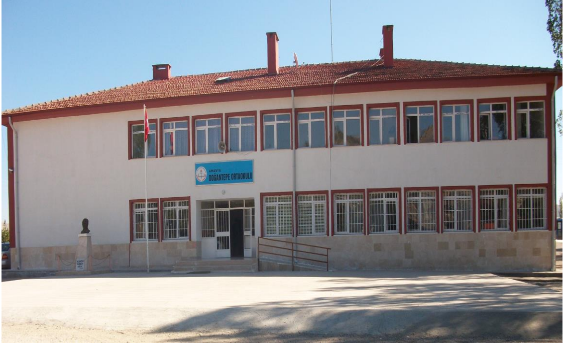
Okulumuzun Ortaokul Binası