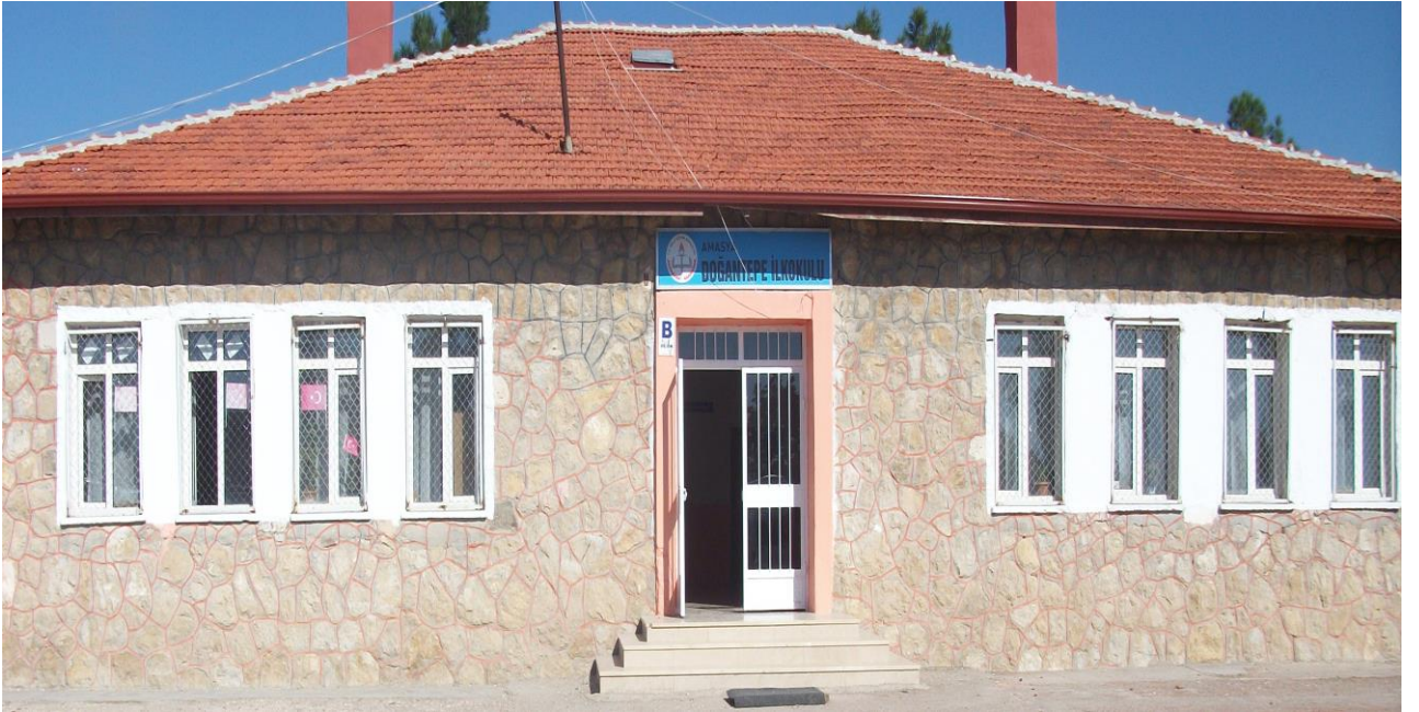
Okulumuzun İlkokul Binası